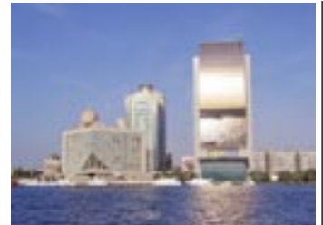
> Dubai Creek <

Übrigens: Gerne zeigen wir Ihnen unseren eigenen Film über unsere Exklusiv-Reise-Dubai.