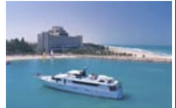
> Hotel Jebel Ali <